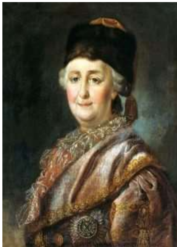
«Портрет Екатерины II в дорожном костюме», Михаил Шибанов, 1787 год, Государственный Русский музей, Санкт-Петербург

ОТКРЫТОЕ ЗАНЯТИЕ С ВОСПИТАННИКАМИ ПОДГОТОВИТЕЛЬНОЙ К ШКОЛЕ ГРУППЫ ПО ПОЗНАВАТЕЛЬНОМУ РАЗВИТИЮ ПО ТЕМЕ «ЕКАТЕРИНА ВЕЛИКАЯ»